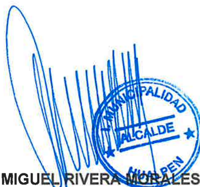
MIGUEL RIVERA MORALES ALCALDE MUNICIPALIDAD DE HUALPÉN