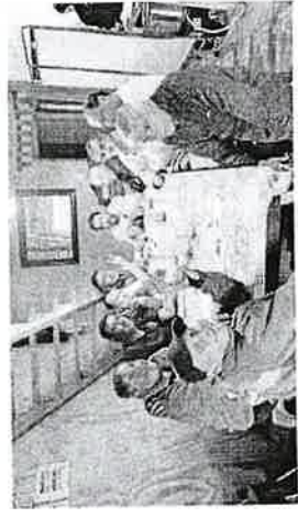
(Comedor, Albergue Hualpén PPC 2025)