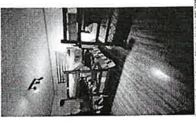
(Distribución de la recepción para albergue Hualpén PPC 2025)